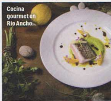
Cocina gourmet en Río Ancho.