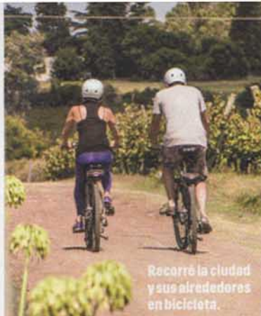
Recorré la ciudad y sus alrededores en bicicleta.

¿Tarjeta o efectivo? Si llevás cash, tené en cuenta que si bien en Colonia aceptan pesos argentinos, por lo general lo hacen a un tipo de cambio bajo. La recomendación es llevar dólares y cambiarlos por pesos uruguayos. Si vas a usar la tarjeta de crédito, recordá el recargo del 35%.