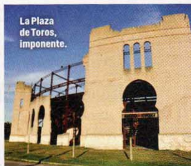
La Plaza de Toros, imponente.