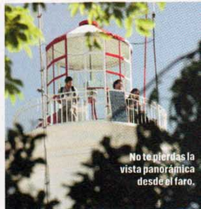
No te pierdas la vista panorámica desde el faro.

tanto de día como de noche. Cuando se pone el sol, los faroles crean juegos de luces y sombras en las calles, los restaurantes encienden velas para esperar a los comensales y algunos bares ofrecen música en vivo. Un consejo: llevá abrigo. Como las construcciones son bajas y la ciudad está pegada al río, siempre refresca.